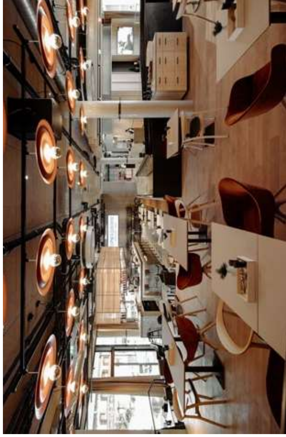
Platz für bis zu 500 Pers. mit zentraler Bar & zwei Terrassen

An das Bistro grenzen zwei große Terrassen die ebenfalls mitgebucht und in dein Event miteinbezogen werden können. Ideal für Sommerpartys oder Glühwein Empfang im Winter. Du siehst, das Dips&Drops mit seinem Bistro & Bar ist so flexibel, wie du es brauchst. Let's talk about your plans.