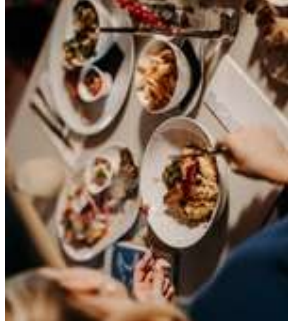
Dinner und Lunch im Bistro