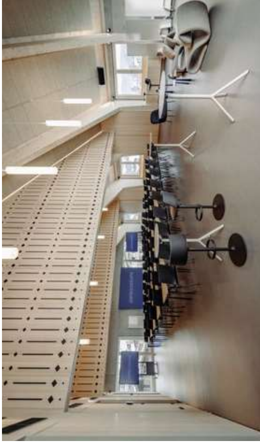
Insgesamt 210 m 2 für bis zu 200 Pers. halbtags • ganztags buchbar

Als XL-Location mit 210 m 2 bietet er Platz für bis zu 205 Personen. Mit mobilen Trennwänden, kann der Event Horizon auch in bis zu drei Räume gesplittet werden. Zusammen mit dem Living Room ergeben sich so coole Optionen für die Teams und ihre Ideen.