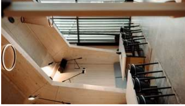
Pausieren, stärken und Brainstormen im Living Room